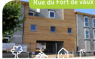
Rue du Fort de vaux

Construction de 14 logements de type 2, 3 et 4, bâtiment basse consommation. Coût des travaux : 1 677 000 € TTC